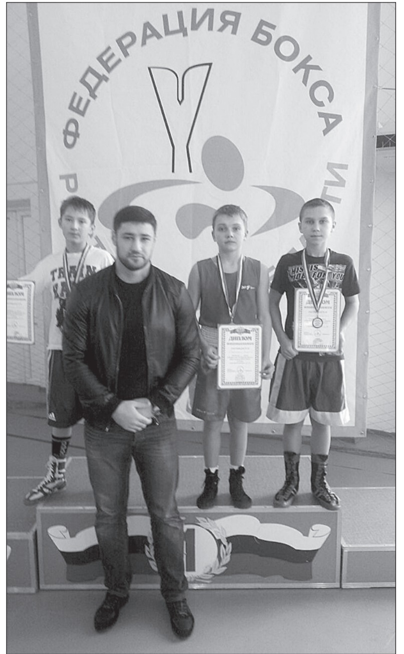
МАЛЬЧИШЕК НАГРАЖДАН ОДИН ИЗ ЛУЧШИХ БОКСЕРОВ РОССИИ ГАСАН ГИМБАТОВ.

В конце марта самая молодая сборная области выступит в чемпионате ЮФО, который пройдет в городе Волжском Волгоградской области.