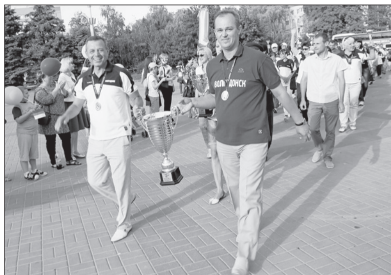
ПЕРВЫЙ КУБОК ЗА ПОБЕДУ В СПАРТАКИАДЕ ДОНА УЕХАЛ В ВОЛГОДОНСК.

Кроме того, областное министерство по физической культуре и спорту объявило конкурс на лучшие слоган, логотип, флаг и символ спартакиадного движения. В нем может принять участие каждый житель Ростовской области. Для этого необходимо до 15 марта предоставить свои работы по адресу г. Ростов-на-Дону, ул. Красноармейская, 68, кабинет 216 или отправить их на электронную почту of2679116@yandex.ru с пометкой «Символика Спартакиады Дона». К своему произведению автор (а может, авторский коллектив) должны приложить заявку на участие с указанием контактных данных и сопроводительное письмо с расшифровкой своего творческого замысла.