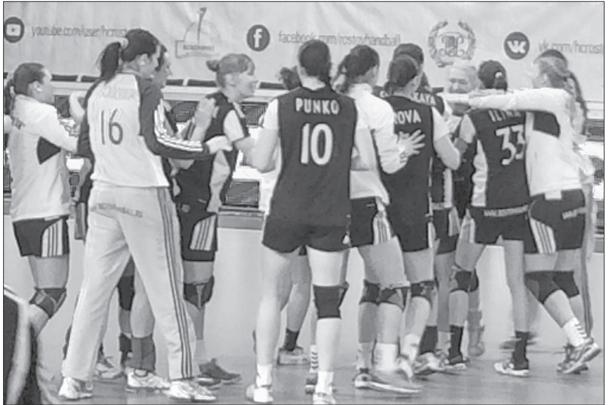
ВЧЕРА. РОСТОВ-НА-ДОНУ. ГАНДБОЛИСТКИ «РОСТОВ-ДОНА» В СЕДЬМОЙ РАЗ ВЫИГРАЛИ КУБОК РОССИИ

В начале второй половины встречи «Кубань» попыталась, что называется, огрызнуться. Однако единственное, что удалось гандболисткам из Краснодара — это свести пре-